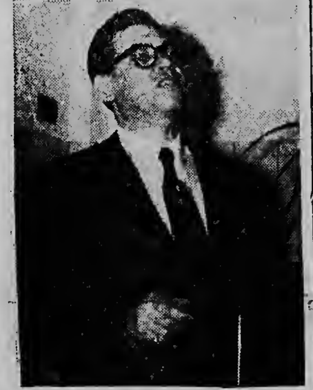
Ministro J. E. Yrausquin durante su discurso diasabra atardi u.p.

„Nos tabatin tres motibo importante pa fabricacion dje planta aki”: asina Ministro Yrausquin a bisa diasabra atardi den su discurso a. termina e perdida di casi mei miljoon flor anja; cu e fabrica banw; b. entrega di awa na henter e poblacion; c. un riquismo fuente di awa y electricidad cual por worde utiliza despues pa industria; na e lo establece nan mes aki den futuro. Nos a mira e dos prome nan bina na realidad eba y awor nos ta trahando duro pa e di tres tambe lo por tuma lugar.”